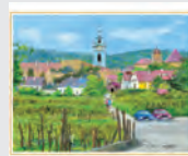
1-2月 ウィーン郊外の村/ オーストリア