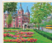
3-4月 市民劇場の通り/ オランダ