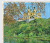
9-10月 秋のメルク修道院/オーストリア