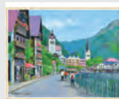
7-8月 ハルシュタット湖畔の道/ オーストリア