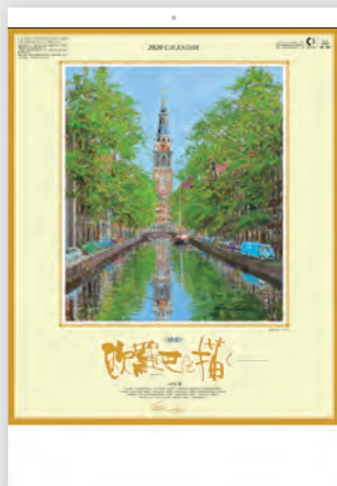
運河の並木/オランダ