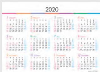
※12月裏面には年表を掲載